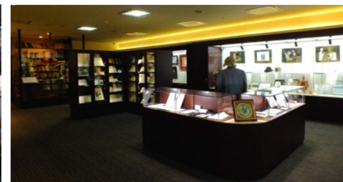
中村元博士の研究業績を紹介する展示室