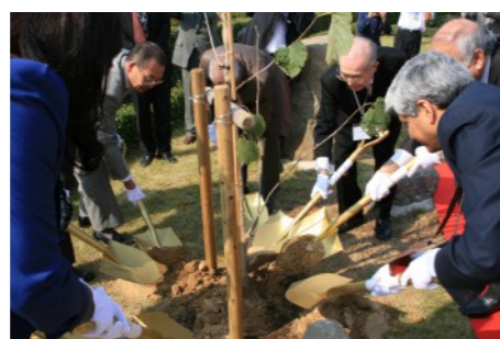
開館記念植樹の様子