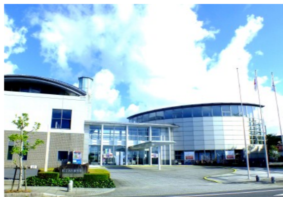
中村元記念館がある松江市役所八束支所外観

今回は中村元記念館通信開館特別号として、オープニングイベントの様子をお伝えします！