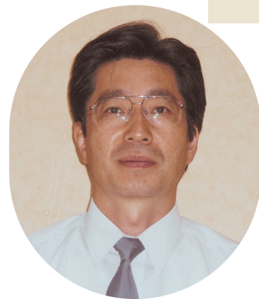
ブツダと白隠禅師展 実行委員会事務局長