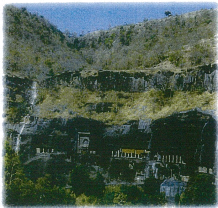
(世界遺産:アジャンタ石窟寺院群/イメージ)